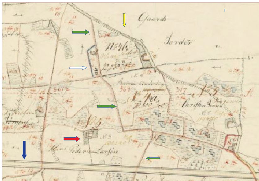
Udsnit af kort over Skallebølle i 1810 fra Geodattstyrelsens "Historiske Kort på Nettet". Gangstiens forløb er vist med grøn pil, Hovedvejen med blå pil, Kelstrupvejen med gul pil, Grønlunds be-liggenhed med rød pil, og Thomsens Hus med hvid pil.

ne, og hvor den stadigvæk går. Den er faktisk blevet flyttet flere gange. Det ældste kort fra Geodatastyrelsens "Historiske kort på nettet" over Skallebølle er fra 1810, og der kan man se, at den sidste del af Gangstien fra Thomsens Hus og til Kelstrupvejen løber som i dag, mens den første del fra Hovedvejen til Thomsens Hus har et helt andet forløb. Den begynder nu ved Hovedvejen i skellet mellem det, der engang skulle blive Elektrikerens Hus (Odensevej 130) og Anna Godtfredsens Hus (Odensevej 132) og følger det fremtidige skel ned til Mosen, hvor den først laver et knæk mod vest og senere et knæk op mod Thomsens Hus. Sådant har den gået indtil engang i slutningen af 1930'erne, hvor først Vandværket blev bygget nede ved Mosen i 1938 og Elektrikerens Hus i 1939. Den blev så i første omgang flyttet som vist på kortet over Skallebølle fra 1884 (opdateret indtil 1940), hvor det nye forløb lige