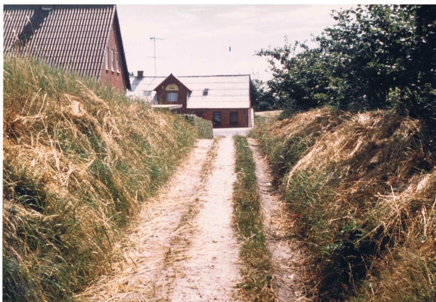
Gangstien med Nøddebo i baggrunden og Barberens Hus til venstre fra den første halvdel af 1970'erne.

ad Gangstien sådan en tidlig morgen i maj med alle de dufte af køer og græs og vilde blomster var fantastisk. Især turen forbi Thomsens Hus og deres dejlige have op ad den sidste bakke var vidunderlig, og så blev turen afsluttet med et kik ind i Lærer Madsens smukke have i den gamle skole.