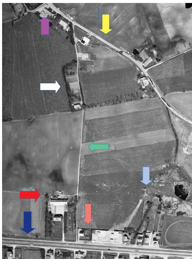
Fotografi af Gangstien (grøn pil) i Skallebølle i 1966 fra "Danmark set fra Luften". Hovedvejen er vist med blå pil, Kelstrupvejen med gul pil, Grønlund med rød pil, Barberens Hus orange pil, Thomsens Hus med hvid pil, og den gamle skole med violet pil. Resterne af det gamle vandværk nede ved Mosen kan lige skelnes (lyseblå pil).