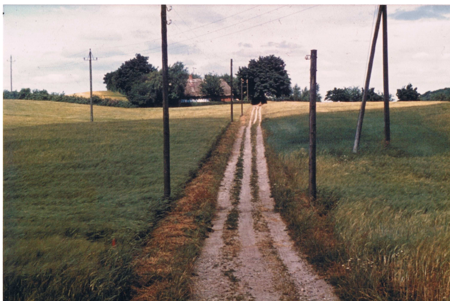
Gangstien op mod Thomsens Hus fra den første halvdel af 1970'erne.

Gangstien jo i en fin tilstand. Den første del af Gangstien fra Hovedvejen var en hulvej, som det kan ses på fotografiet af Gangstien op mod Nøddebo, og den blev efterfulgt af en temmelig stejl bakke ned mod bag-indkørslen til Grønlund. Om vinteren, når det sneede, og dengang i 1950'erne sneede det meget, kunne