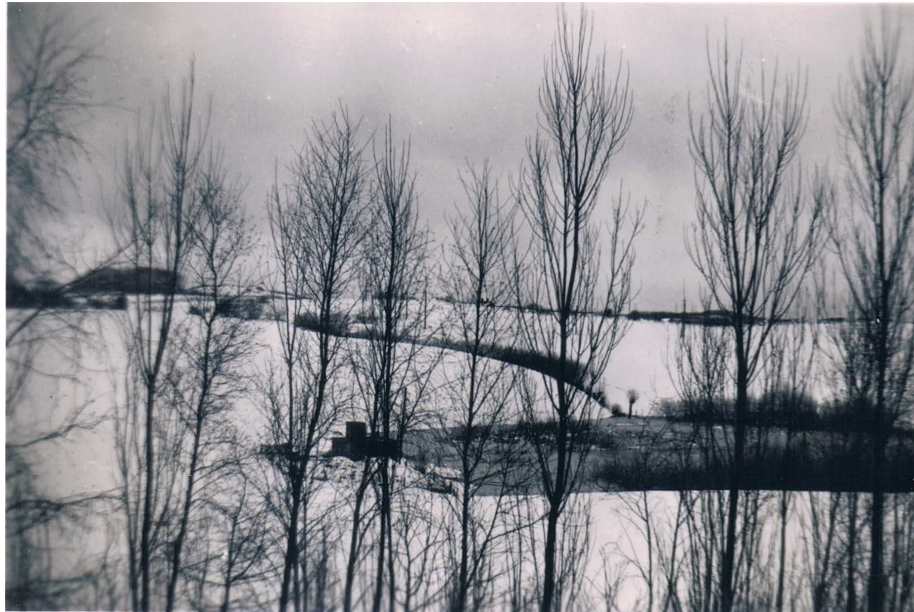
Fotografi fra cirka 1952 ned mod resterne af det gamle vandværk og med Mosen til højre. Fotografiet er taget fra 1.sal hos Elektrikerens. Kelstrupvejen kan lige anes i baggrunden. Gangstien fra 1810 gik højre om det sted, hvor det gamle vandværk kom til at ligge.

skulle fra Gangstien til den nye skole. Hele området er bebygget med parcelhuse omkranset af kæmpestore ligusterhække. Det sidste billede viser Gangstien i juni måned 2020 taget nogenlunde fra samme sted, som fotografiet op mod Thomsens Hus vist tidligere. Man kan med rette sige, at udviklingen ikke har været god ved Gangstien.