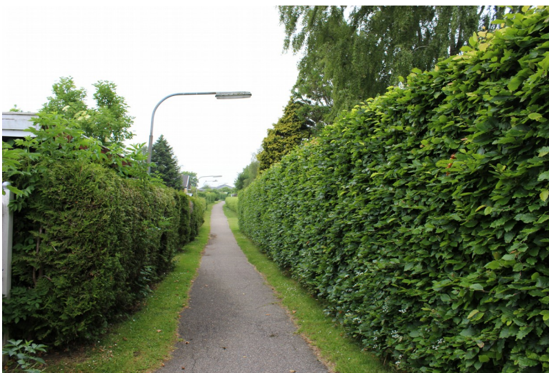
Fotografi af Gangstien op mod Thomsens Hus taget i juni 2020.